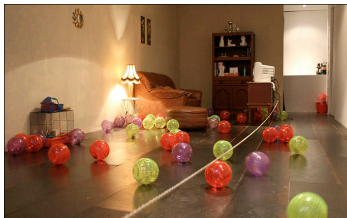
Save the Pets (2008) van kunstenaars Tinkebell

C Hij schildert voor die tijd bijzondere onderwerpen