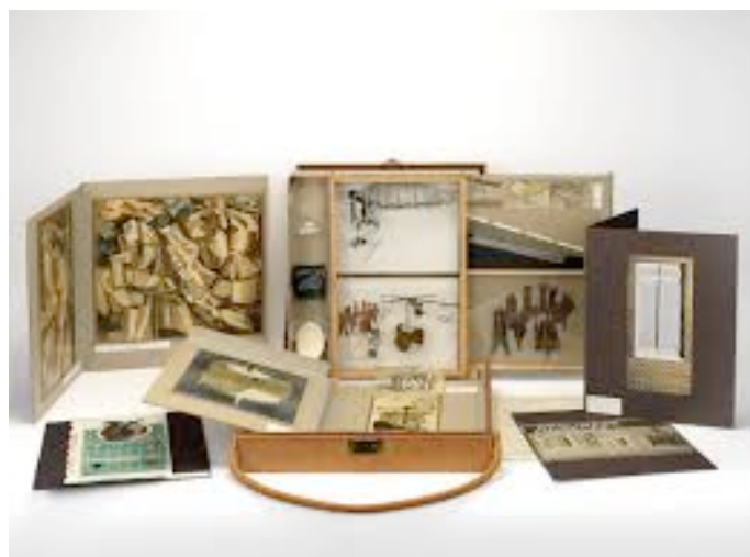
Marcel Duchamp, Van of door Marcel Duchamp of Rose Sélavy (De doos in een koffer) , 1952, Museum Boijmans Van Beuningen, Rotterdam

1 Hoe worden de kunstwerken van Marcel Duchamp ook wel genoemd?